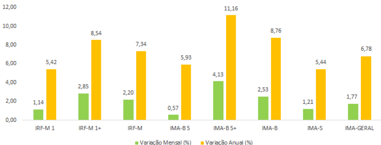
Rentabilidades do IMA em Maio e no ano - (%)

É o terceiro mês consecutivo que as NTN-Bs de prazos acima de cinco anos registram o melhor desempenho no período, sugerindo que o mercado pode ter iniciado um ciclo de valorização dos ativos diante da sequência dos novos resultados positivos de inflação em maio, que vieram abaixo da previsão do mercado. Além disso, um cenário macro mais propositivo, induzido pelo avanço surpreendente de 1,9% do PIB no primeiro trimestre e pela aprovação do arcabouço fiscal, mitigou incertezas de médio e longo prazos no radar dos investidores e reduziu a aversão ao risco. Entre os prefixados, os subíndices de prazos mais longos também apresentaram melhor performance. O IRF-M 1+, de prazo acima de